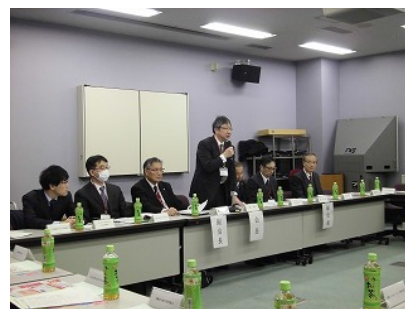
昨年度第2回総会の様子